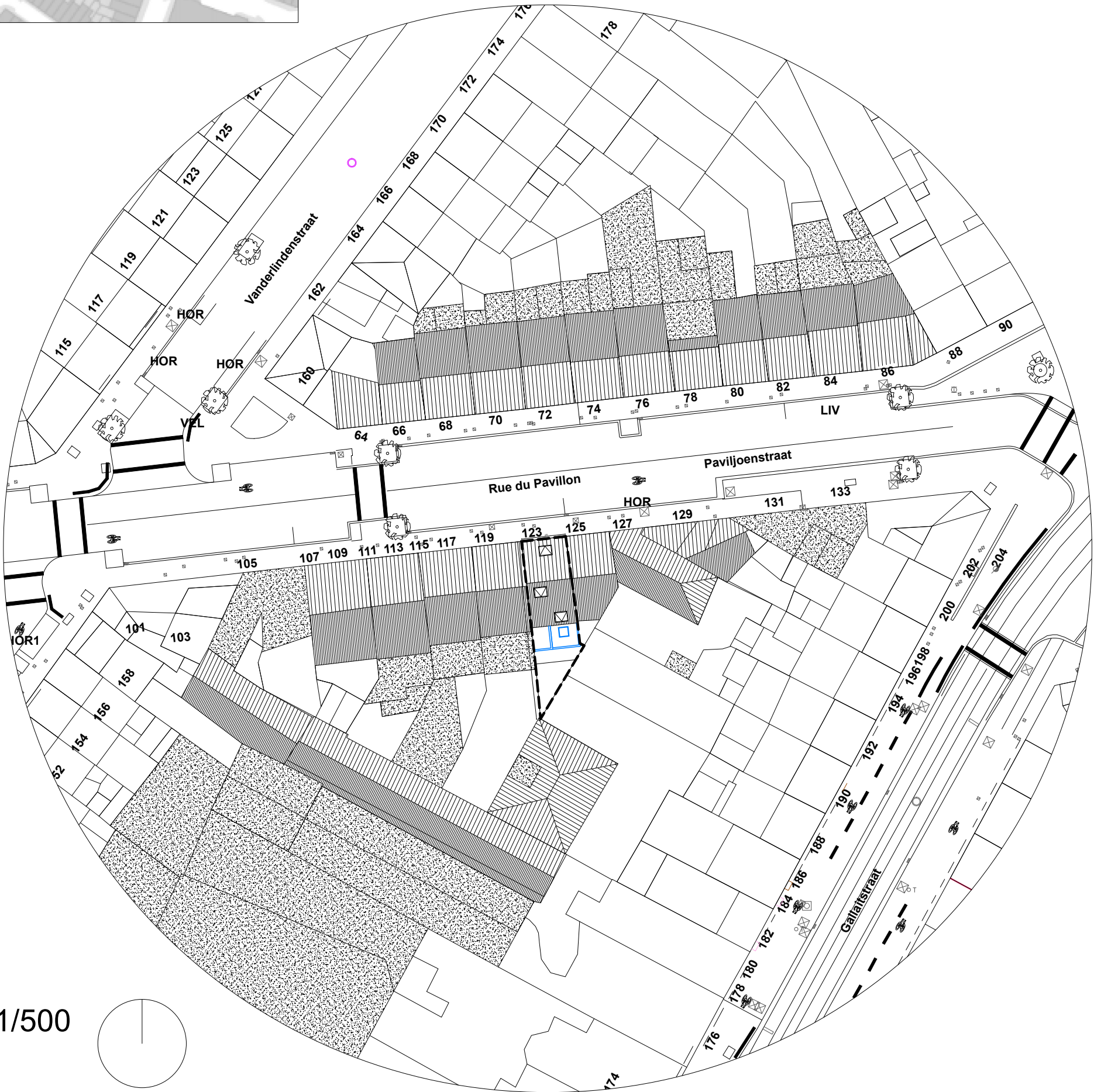
Plan d'implantation Ech : 1/500