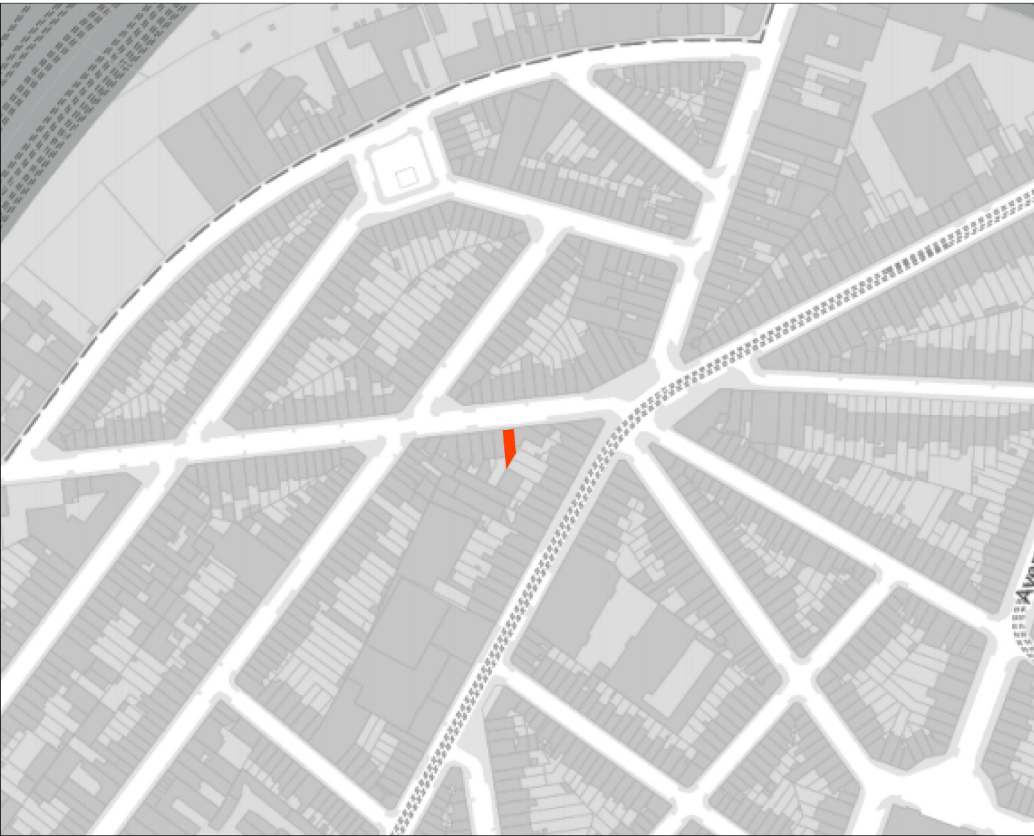
Plan de situation Ech : 1/2500